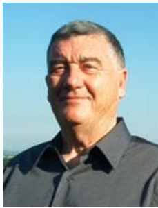
Claude Poher, prvi ravnatelj GEPAN-a, službenog odbora unutar Francuske svemirske agencije. GEPAN je počeo prikupljati podatke o NLO-ima od 1977. godine. Nakon dvije godine istraživanja, Poher je zaključio da su NLO-i stvaran fenomen.

1979. godine, nakon dvije godine rada, Claude Poher je došao do zaključka da su NLO-i stvarni. Svoje nalaze je prezentirao vijeću, a nakon toga je uzeo jednogodišnji odmor i otišao na plovidbu oko svijeta. GEPAN je nastavio prikupljati podatke o NLO-ima sa novim ravnateljem, Alain Esterleom.